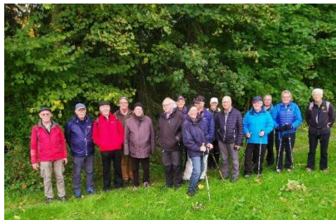
.....mit einer Rekordbeteiligung